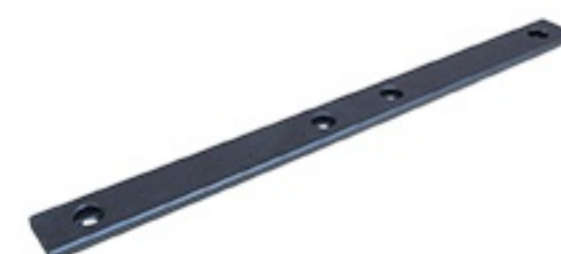
ATL BSC050 ATL BSC100