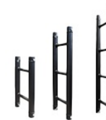
ATL29 H050 ATL29 H075 ATL29 H100