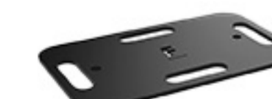
ATL BAL 10